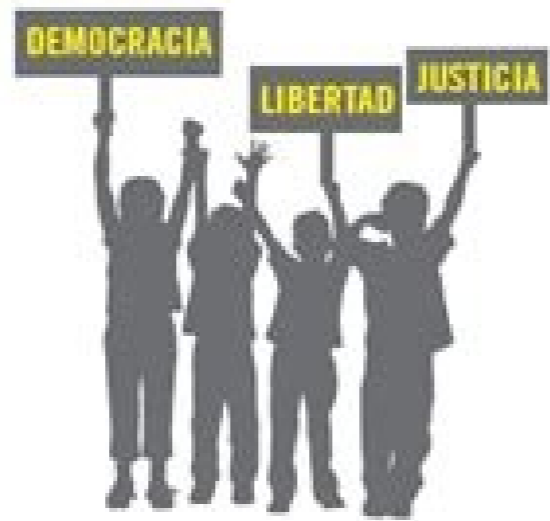
Amnistía internacional informe peru.

EN MUCHOS CASOS POR HABER PARTICIPADO LAS VÍCTIMAS EN MANIFESTACIONES CONTRA EL GOBIERNO.